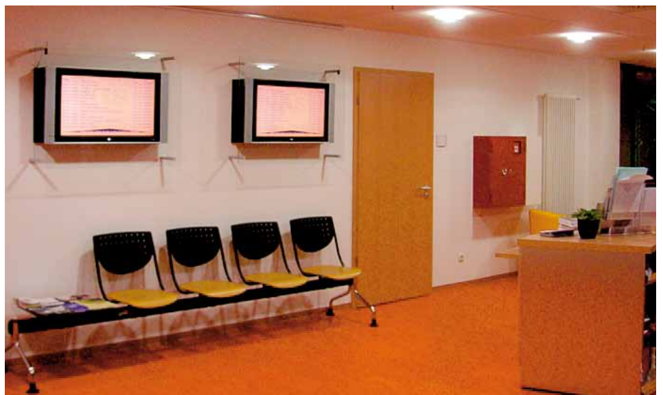
Beispiele und Fotos von Installationen bei Kunden finden Sie unter www.kufer.de/Raumanzeige

Steuerung der Heizung für Ihre Unterrichtsräume anhand der Belegung